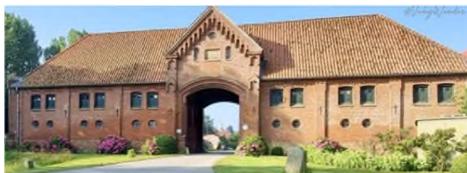
Das Torhaus vor dem Brand

Das 1864 erbaute Torhaus, welches unter Denkmalschutz steht, brannte bis auf die Grundmauern nieder. Die Brandursache ist noch unklar.