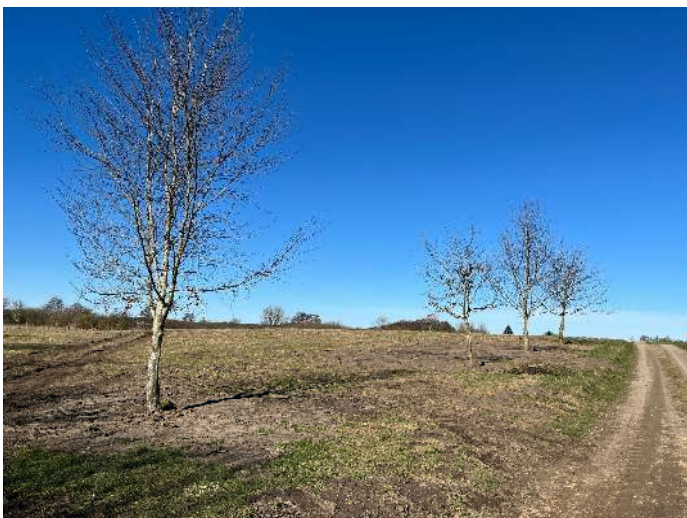
Erste Baumpflanzungen auf der Ausgleichsfläche

Manch einer hat sich in den letzten Wochen vielleicht über die Aktivitäten auf der angrenzend an das Naturschutzgebiet „Nordteil des Selenter Sees“ liegenden Fläche zwischen dem Höben und dem Selenter See in Giekau gewundert. Dort sind verschiedene Maßnahmen vorgenommen worden, deren Sinn auf den ersten Blick vielleicht nicht erkenn-