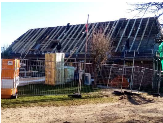
Beginn Dachsanierung Seekrug

Nach einem vom beauftragten Architekturbüro vorgenommenen beschränkten Ausschreibungsverfahren wurde der Firma Hass aus Engelau als günstigstem Bieter der Auftrag erteilt. Die Bauarbeiten werden ca. 10 bis 12 Wochen andauern.