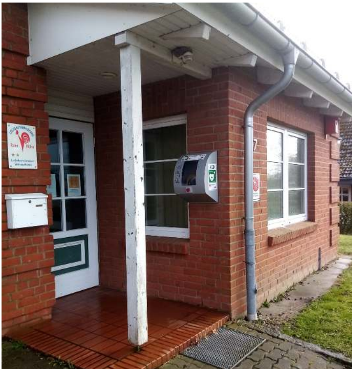
Defibrillator am Feuerwehrgerätehaus in Giekau

Die Gemeinde hat im letzten Jahr beschlossen, zwei Defibrillatoren (AED) zu beschaffen. Die Geräte sind nunmehr geliefert worden. Der SV Giekau hat sich dem Vorhaben angeschlossen und so